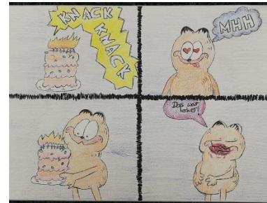
Emma Sastedt, Klasse 8 c