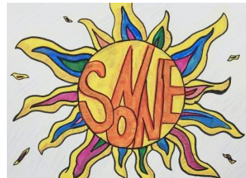
Melanie Enns, Klasse 8 a